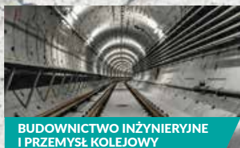
BUDOWNICTWO INŻYNIERYJNE I PRZEMYSŁ KOLEJOWY