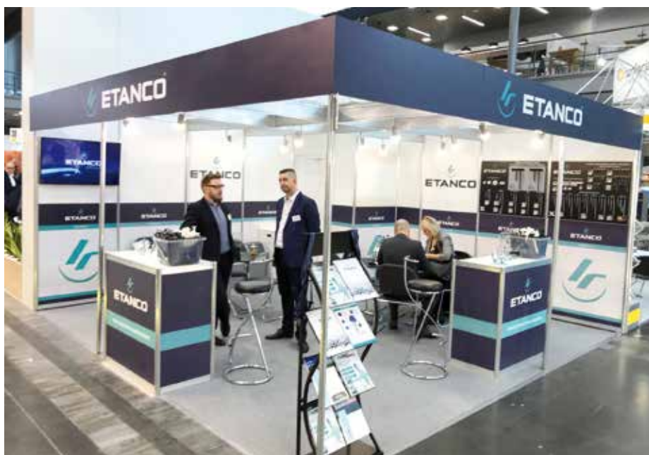
▲ Stoisko Etanco na Budmie 2019

O sukcesie Etanco podczas tegorocznej edycji targów Budma świadczy przede wszystkim duża liczba odwiedzających stoisko. Wśród nich byli dotychczasowi