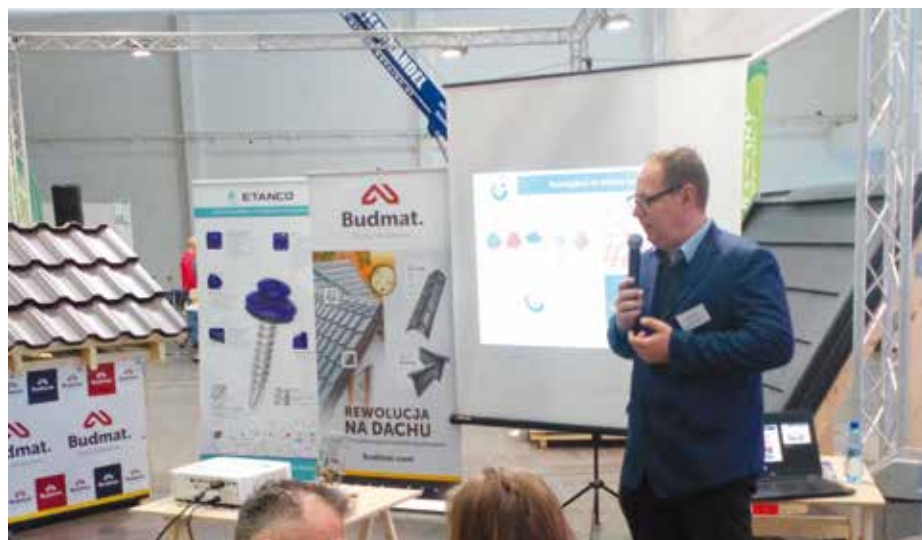
▲ Wkręty Etanco używane były podczas pokazów na stoisku Budmat

partnerzy, ale również potencjalni klienci z kraju i z zagranicy. Zespół sprzedaży eksportowej Etanco odbył wiele rozmów biznesowych, które przelożą się na obecność produktów Etanco w nowych obszarach inwestycyjnych.